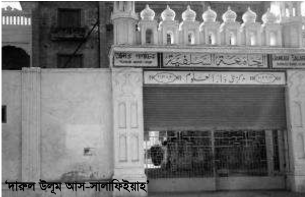
'দারুল উলুম আস-সালাফিইয়াহ'