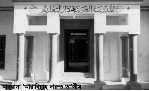
মাদরাসা 'আরাবিয়াহ দারুত তা'লীম