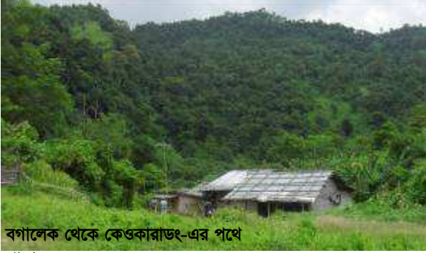
বগালেক থেকে কেওকারাডং-এর পথে