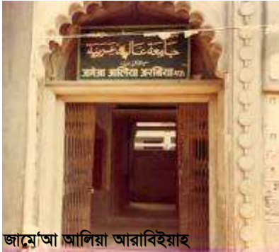
জামে'আ আলিয়া আরাবিহিয়াহ

মউনাখভঞ্জন : ১১ই জানুয়ারীতে আয়মগড় 'দারুল মুহাম্মাদী' থেকে বিদায় নিয়ে আমরা সোজা উত্তর প্রদেশের মউ রওয়ানা হলাম। আহলেহাদীছ-এর অন্যতম প্রধান কেন্দ্র। মউনাখভঞ্জন বলে পরিচিত এই শহরে আহলেহাদীছ মাদরাসা ৩টি ও হানাফী মাদরাসা ১টি। যার নাম মিকতালুল উলুম। সবগুলিই বড় বড়। আহলেহাদীছের সবচেয়ে প্রাচীন মাদরাসা হ'ল জামে'আ আলিয়া আরাবিহিয়াহ, যা ১২৮৫