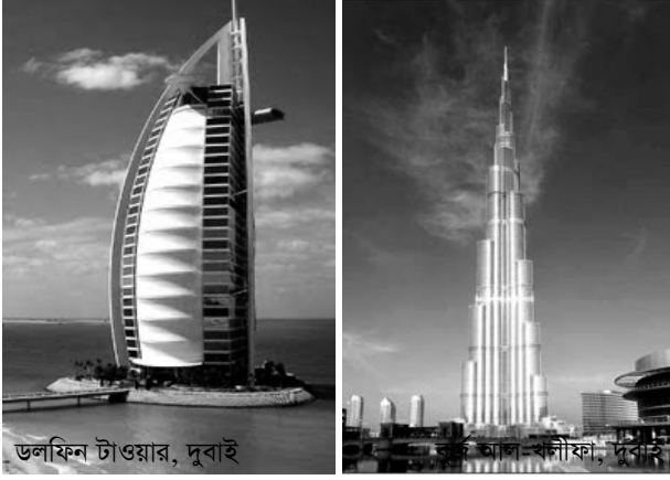
ডলফিন টাওয়ার, দুবাই

তার ভাল সম্পর্ক। ফলে পীস টিভি কর্তৃপক্ষের সাথে তিনি সময় দেন। উভয়েই উচ্চ বেতনের চাকরী করেন অনেক দিন যাবৎ। অফিস