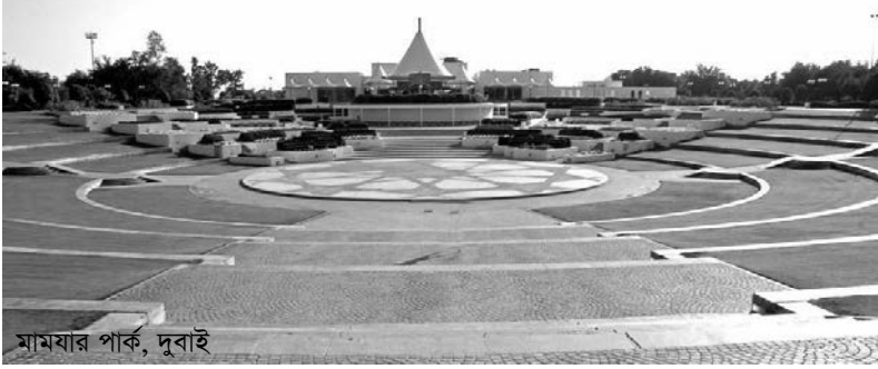
মাম্বার পার্ক, দুবাই